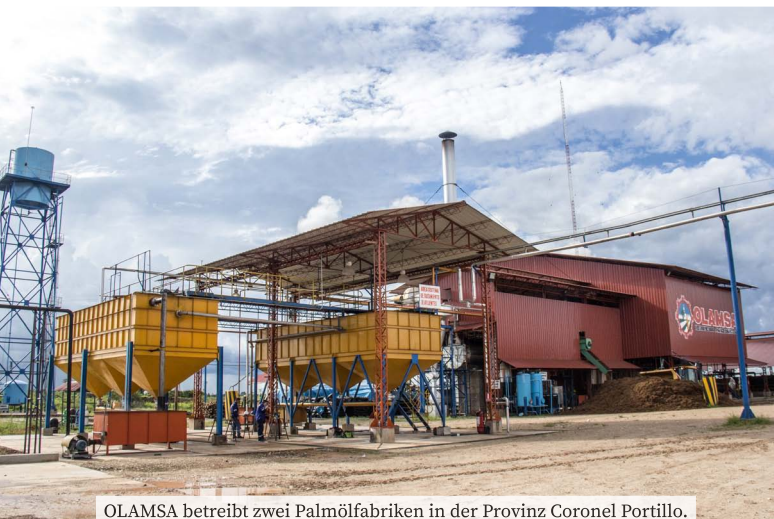
OLAMSA betreibt zwei Palmölfabriken in der Provinz Coronel Portillo.

Hierzu schlägt die Informationsstelle Peru eine Briefaktion an den peruanischen Minister für Landwirtschaft und Bewässerung vor (siehe Kasten unten).