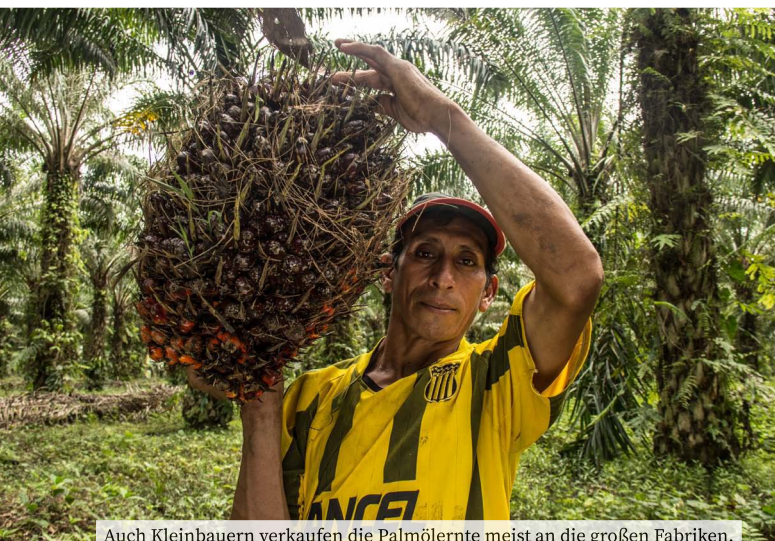
Auch Kleinbauern verkaufen die Palmölernte meist an die großen Fabriken.

Außerdem erhöht sich der Druck auf das Land, es wird dadurch zur Ware, um die gekämpft und mit der gehandelt wird. Menschenrechtsverletzungen, Lebenswelt- und Umweltzerstörung führen zu vielfältigen Konflikten. Die Palmölproduktion ist Teil einer kritisch zu sehenden Modernisierungsstrategie: Kleinbauern geben dafür die Nahrungsmittelproduktion, z. B. Reis auf.